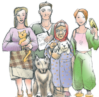
органи самоорганізації населення (ОСН)