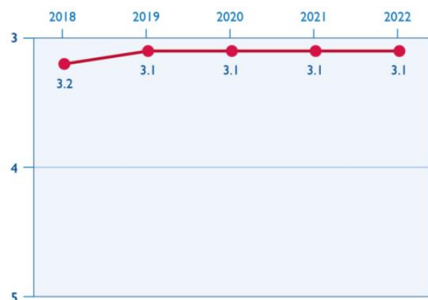
ОРГАНІЗАЦІЙНА СПРОМОЖНІСТЬ В УКРАЇНІ

Відповідно до результатів дослідження «Громадянське суспільство України в умовах війни — 2022», опублікованого у 2023 році ІСАР «Сднання», майже 20% ОГС повідомили про переорієнтацію своєї діяльності відповідно до нових викликів у 2022 році. Тільки чверть ОГС, які розпочали діяльність ще до повномасштабної війни, продовжили її у звичних сферах, а більшість ОГС (56%) поєднували пріоритети довоєнної діяльності з новими напрямками, що виникли внаслідок війни. Переважна більшість ОГС (89%) високо оцінювали актуальність напрямку власної діяльності після завершення війни в Україні.