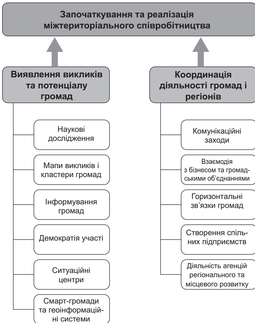
Рис. 3. Екосистема розвитку міжтериторіального співробітництва